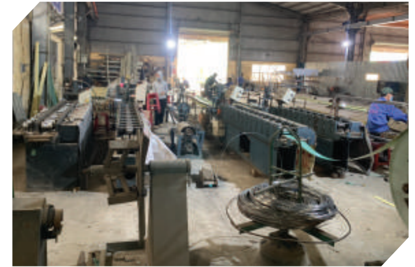
Máy Uốn Ống Dày 20 ly